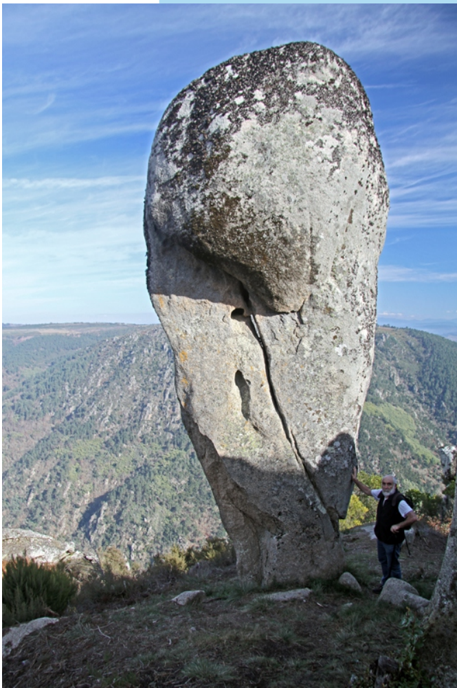
A Pedra Longa