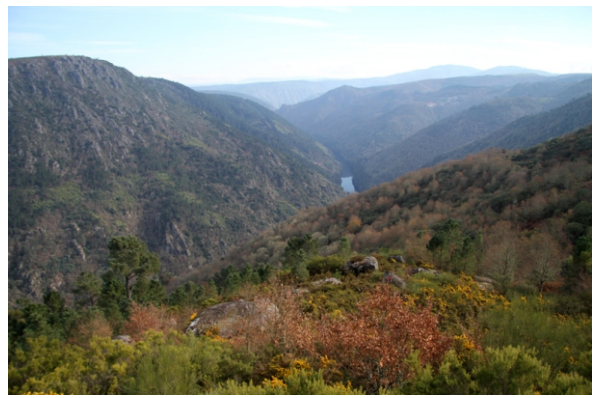
Vista desde o miradoiro da Lampa

Para percorrer este espazo hai outros roteiros entre eles un circular (Luintra, A Moura, Luintra); e outro lineal (Os Peares Santo Estevo) que pasan polos mesmos lugares.