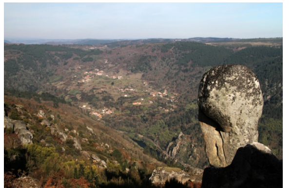
Vista desde o miradoiro de Pedra Longa. Ao fondo Pombeiro (Pantón)

Campo de mámoas das Cabanas. Conxunto de catro enterramentos que datan do 4500 ao 2000 D.C.