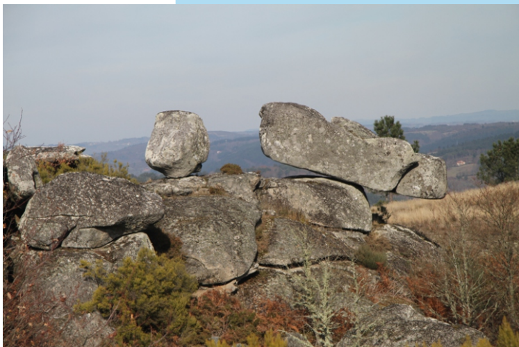
Pedras en equilibrio