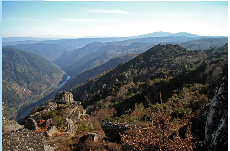
Vista desde o miradoiro de Pedra Longa. Á dereita o castro da Moura

Un percorrido de interese natural e arqueolóxico, para visitar algúns dos miradoiros menos coñecidos do Canón do Sil, curiosas formación creadas pola erosión nas rochas e o campo de mámoas das Cabanas. A ruta dircorre pola parroquia da Moura, no concello de Nogueira de Ramuín, dentro do LIC Canóns do Sil.