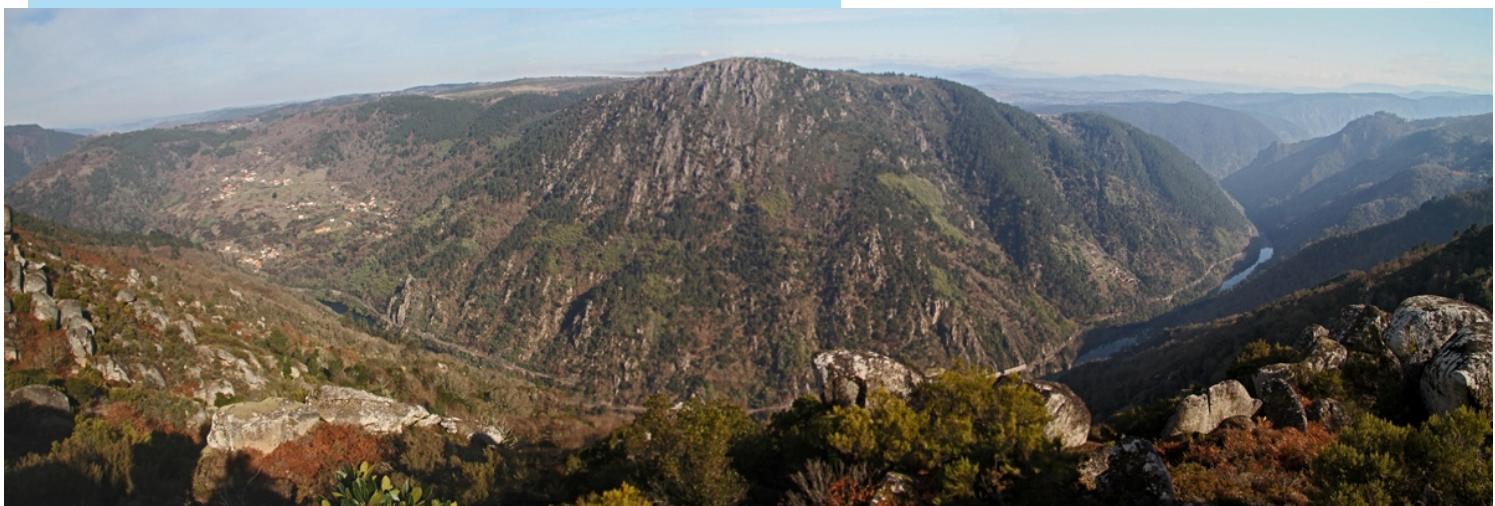
Panorámica desde o miradoiro de Pedra Longa. Pombeiro, na outra banda do Sil