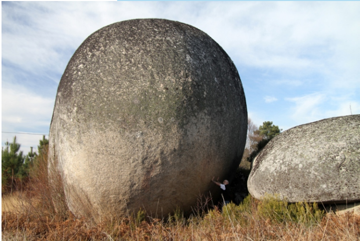
O Penedo do Trigo

Contan que nestas terras unha Moura que ía de viaxe sufriu un encontro infeliz e tivo que enterrar as xoias e o ouro que levaba no interior destes penedos.